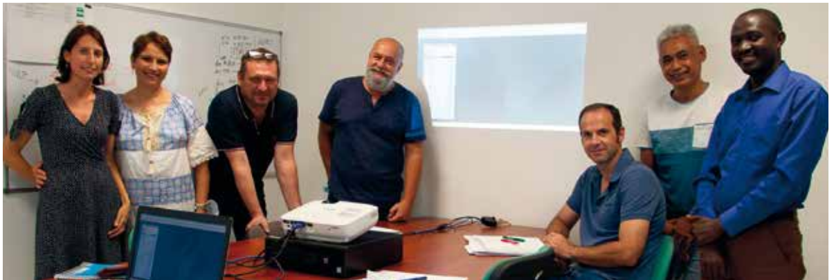
L'équipe projet chargée du développement du logiciel Sydonia World.

Héritage d'une délibération de 1963, le code des douanes a subi plusieurs ajustements qui ne tiennent plus compte des évolutions institutionnelles de la Nouvelle-Calédonie. Ces modifications ont fragilisé la cohérence et la lisibilité des dispositions, rendant la refonte du document plus que nécessaire.