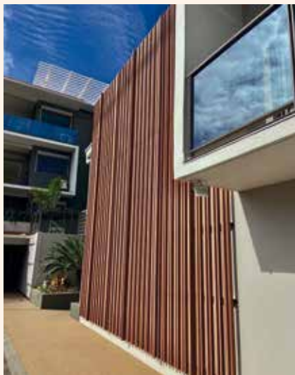
Une réalisation de l'entreprise 3P Pacific Plastic Profile, en 2020 à l'immeuble Latitude Sud.

« Nous avons mis en place les gestes barrières dès le premier confinement, le troisième épisode a été l'occasion de renforcer et réactiver les bonnes habitudes. Un plan de continuité de l'activité a été arrêté, poste par poste. En tant qu'entreprise ne