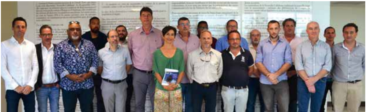
Les premiers lauréats du programme Territoire d'Innovation reçus au Gouvernement en août 2020.

Suite à l'appel à projets national « Territoires d'innovation » lancé fin 2018, la Nouvelle-Calédonie a été sélectionnée en septembre 2019. Des projets innovants dédiés à la valorisation et à la préservation de la biodiversité, peuvent encore intégrer ce programme.